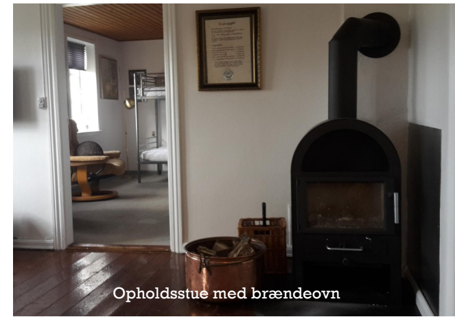
Opholdsstue med brændeovn

Lej klubhuset og inviterer din familie eller venner på en oplevelse/ferie, hvor der ikke er langt til.