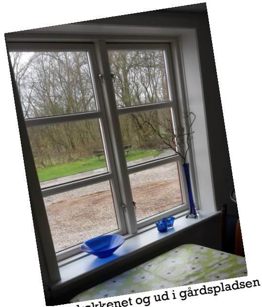
Kik fra køkkenet og ud i gårdspladsen