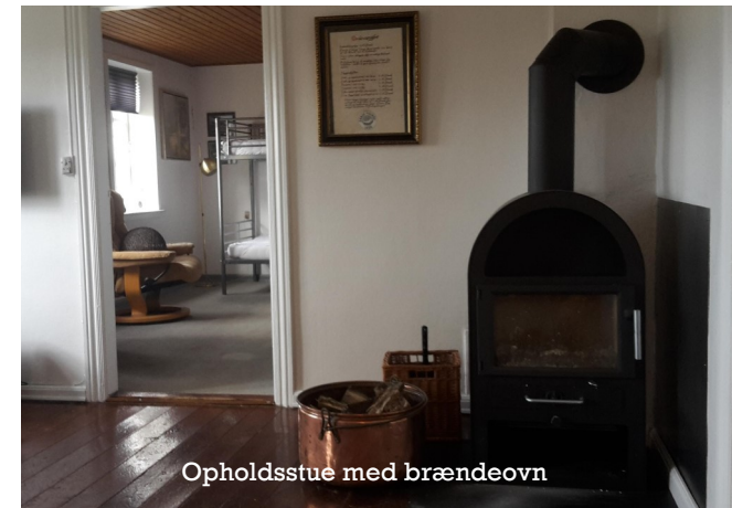
Opholdsstue med brændeovn

Lej klubhuset og inviterer din familie eller venner på en oplevelse/ferie, hvor der ikke er langt til.