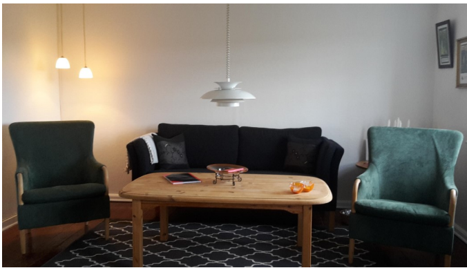
Opholdsstuen med TV med Cromecast