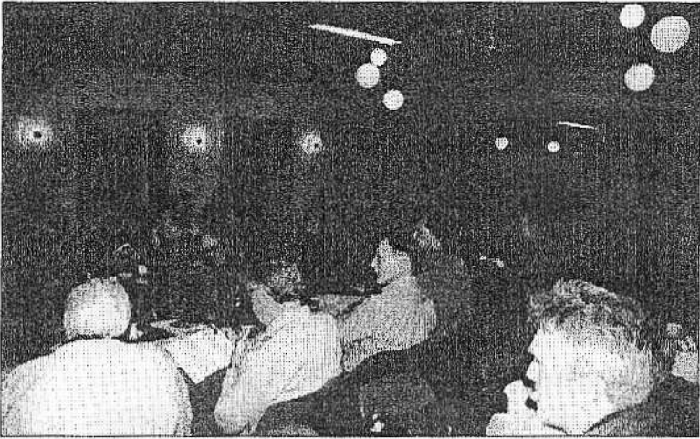
Omtrent 75 medlemmer deltog i generalforsamlingen.