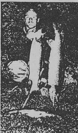
Tre fine september havørreder fra Ribe Vesterå